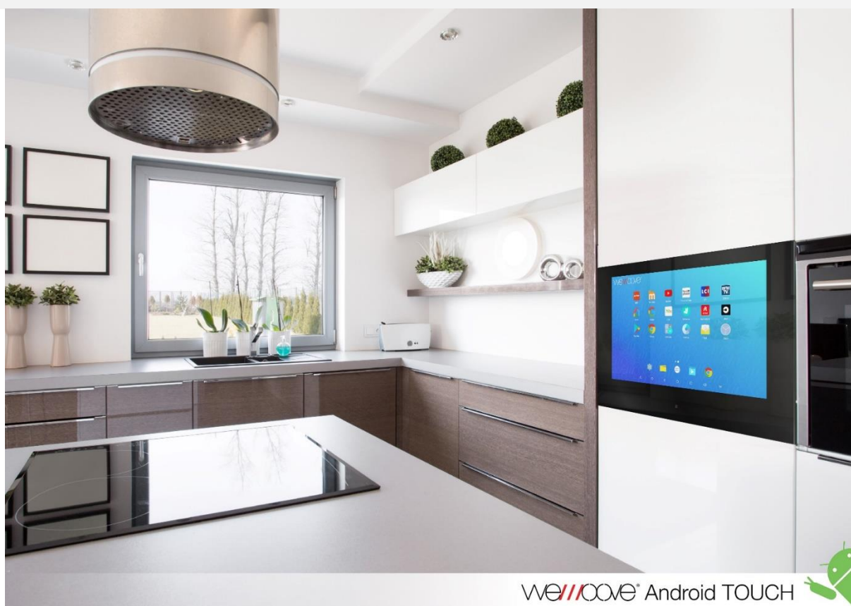
WEMOOVE® Android TOUCH

WEMOOVE est fier d'exposer sur le stand APP-ELLES son écran tactile Android Touch 21,5" encastrable et unique au monde !